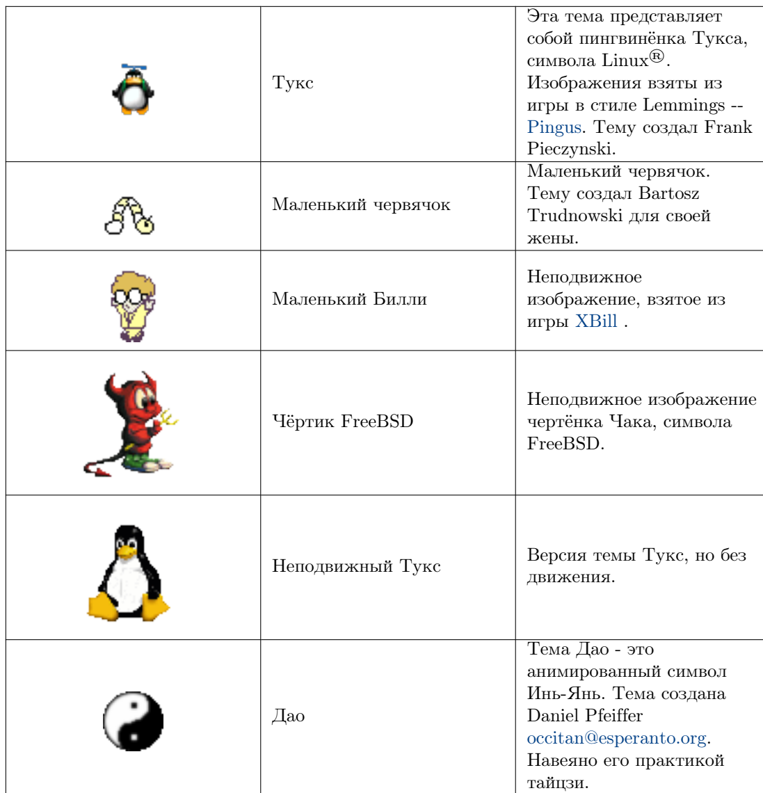
Таблица 2.1: Доступные темы для AMOR