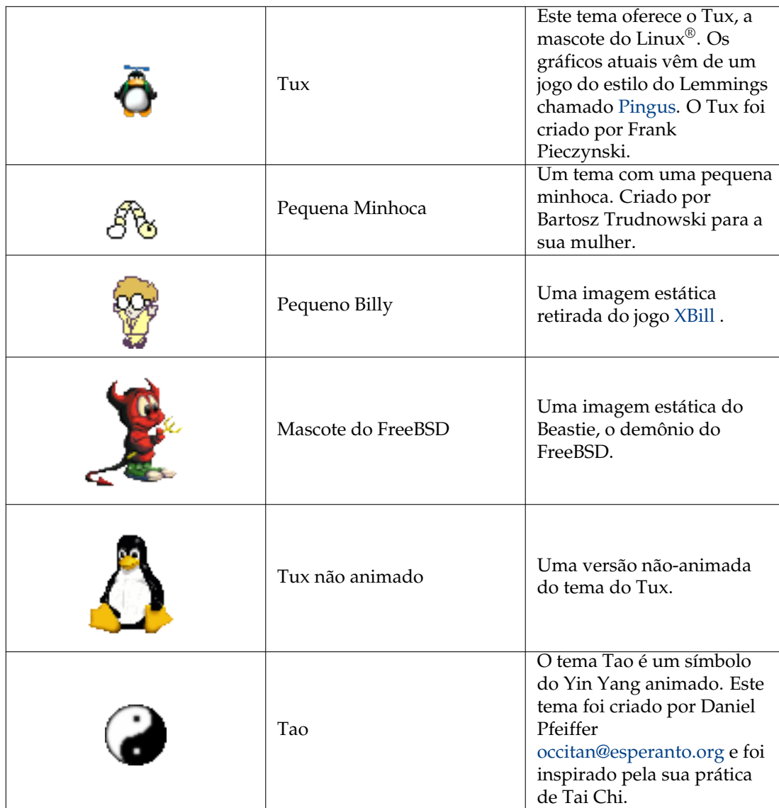
Tabela 2.1: Temas do AMOR disponíveis